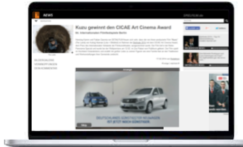
DACIA SANDERO // spielfilm.de